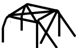
Principe 1 avec la croix en X

Les arceaux fabriqués à partir de coudes à souder sont interdits et devront être construits selon un des deux principes suivants (les tubes coudés sont néanmoins autorisés sur les tubes arrière) :